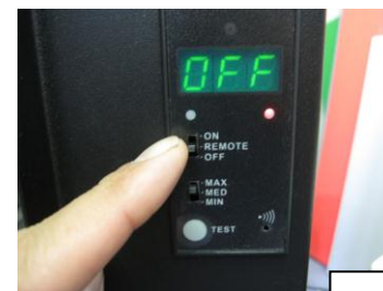
本体手動操作部 (本体側面)

※「A01」「A02」等エラーで停止した場合は、 一旦本体手動操作部のスイッチを「OFF」にして表示が「OFF」になってから、再度「REMOTE」に戻してください。